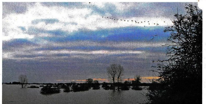
Amerongse Bovenpolder bij hoog water. Was dit ook het uitzicht van de Romeinse soldaten 2000 jaar geleden?

Op de parkeerplaats bij Sportcomplex De Burgwal (TOP Amerongen) in Amerongen start een gemarkeerde wandelroute die langs een uitkijkplatform over de Amerongse Bovenpolder voert. Vanaf dit platform heeft u prachtig uitzicht over de uiterwaarden waar het Romeinse leger in de eerste eeuwen van onze jaartelling actief was.