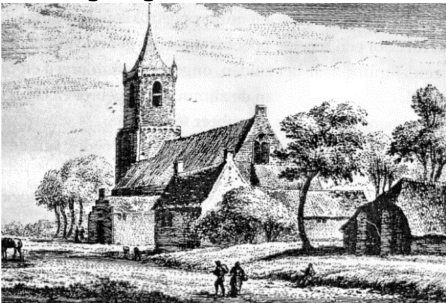
De kerk in 1630.

1 De start is op het kerkplein bij de Michaëlkerk in Leersum. Naar voorrangsweg en RA naar rotonde.