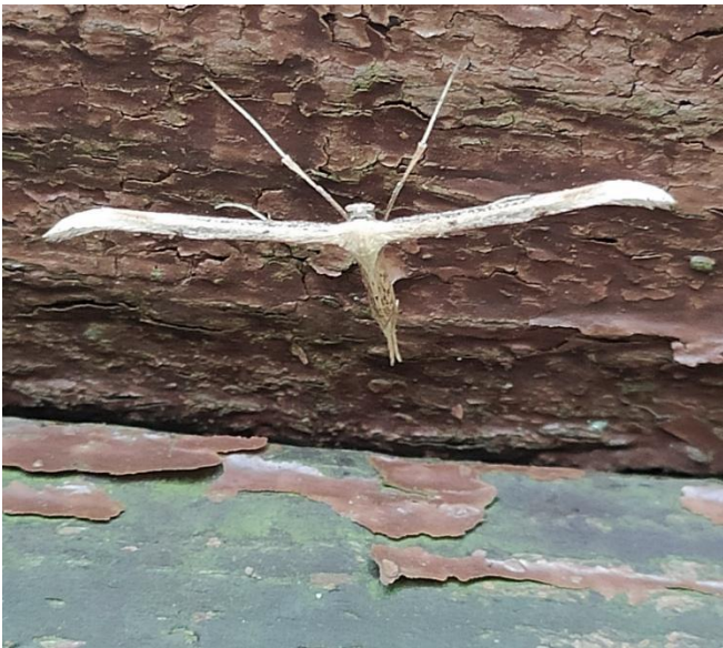
Afb. 4. Windvedermot.

Een bijzondere vorm betreft bijvoorbeeld de zeer lange en dunne grote aardkruiper, de windvedermot met een haaks staande,