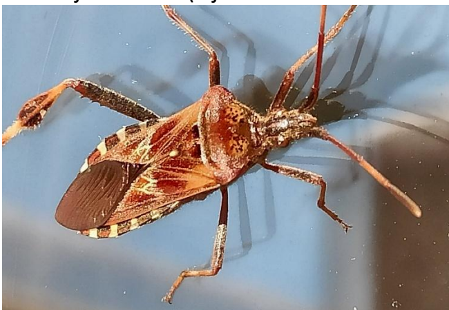
Afb. 1. Bladpootrandwants .

Voor mij is het toch wel een verrassing dat er 30 verschillende soorten wantsen (bijv. de bladpootrandwants) en 12 soorten rode lijstsoorten (vijf kwetsbaar en