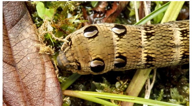
Afb. 6. Deel van Groot Avondroodrups.

Bijzondere momenten zijn het zien van de koninginnenpage en de kolibrievlinder.