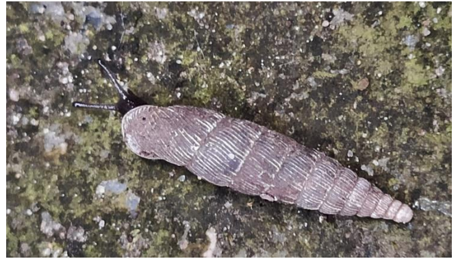
Afb. 5. Penhoornslakje ( gekielde clausilia ).

smalle vleugel en de haften met hun lange staardraden. Heel bijzonder vond ik de eerste vondst van een penhoornslakje, de