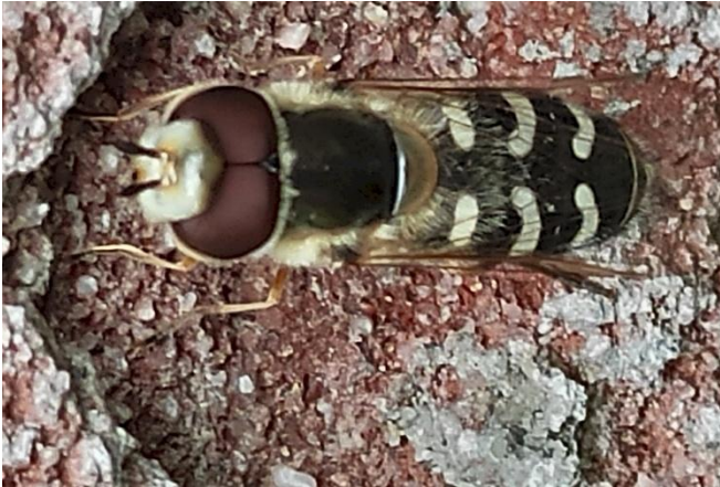
Afb. 3. Witte halvemaan zweefvlieg.

Een niet zo aantrekkelijk dier blijkt bij vergroting zeer fraai te zijn. Opvallend mooi zijn diverse zweefvliegen en