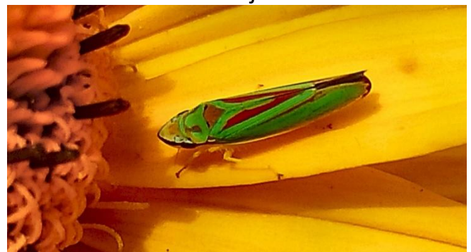
Afb. 2. Rhododendroncicade .

De naamgeving is dikwijls heel bepalend, zoals de kraamwebspin. Bij deze soort worden de spinnetjes in een cocon geboren dat in een web hangt. Voor de opening van deze cocon wordt de wacht gehouden. Bij het licht aanraken van de web zijn de spinnetjes zichtbaar. Ook cicaden verwacht je niet in onze