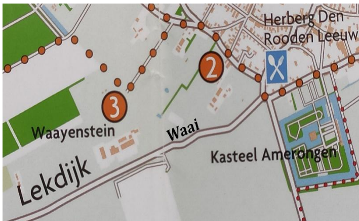
Afb. 1. Detailkaart 'Het Cotlandenpad' met ligging waai.

Op de grens tussen Leersum en Amerongen ligt Waayenstein, ooit een ridderhofstad, nu deel van het landgoed Zuylestein. Jarenlang stonden er een boerderij en een vierkante schuur in totaal ruïneuze toestand; die zijn onlangs mooi gerestaureerd en in woonhuizen omgetoverd. Wie de wandeling 'Het Cotlandenpad' (Van het Loo, 2022, p.3) loopt, komt er vlak langs. Maar vanwaar de naam 'Waayenstein' – is het soms een erg winderige plek? Nee. Die naam kan wel duiden op een waterplas – een waai of wiel – ooit ontstaan door een dijkbreuk.