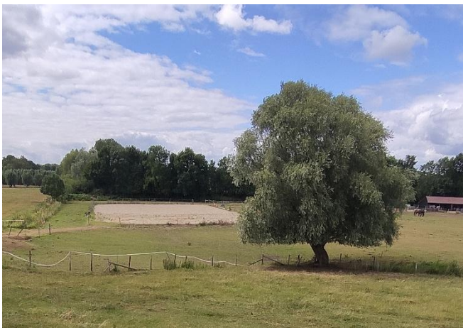
Afb. 7. Wilg en paardenzandbak.

zuidelijker dan het oude tracé hersteld en de waai zal dus binnendijs hebben gelegen. Op dit nieuwe herstelde deel van de dijk is het minder goed aan de ligging van de dijk te zien dat hier sprake is geweest van een dijkdoorbraak. De destijds dichtgegooide waai is echter goed te herkennen doordat deze nog altijd laag in het terrein ligt, op het zuidelijk deel van wat nu de paardenzandbak is, richting wilg. De voormalige waai is vanaf De Roode Leeuw op de Lekdijk naar Wijk bij Duurstede te bereiken via tweede afslag. Tussen de wilg en de paardenzandbak ligt de voormalige waai.