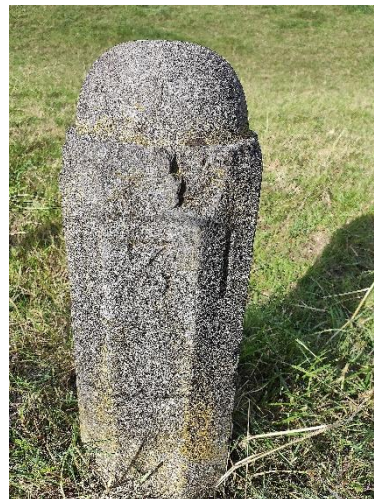
Afb. Dijkpaal 131 nabij stuw van Amerongen.

veel grond werden grotere dijkdelen toegewezen dan aan kleine grondgebruikers. De palen zijn rond 1984 verdwenen, maar op de herstelde dijk bij de stuw resteert o.a. nr. 131.