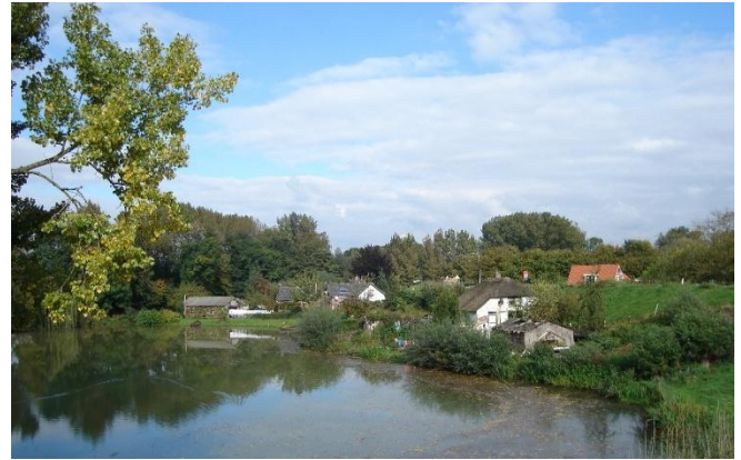
Afb. 2. Een wiel of waai aan de Rijnbanddijk bij Kesteren.

ook wel braak, breek, brekken, gat, kolk, weel en weijert), zie afbeelding 3.