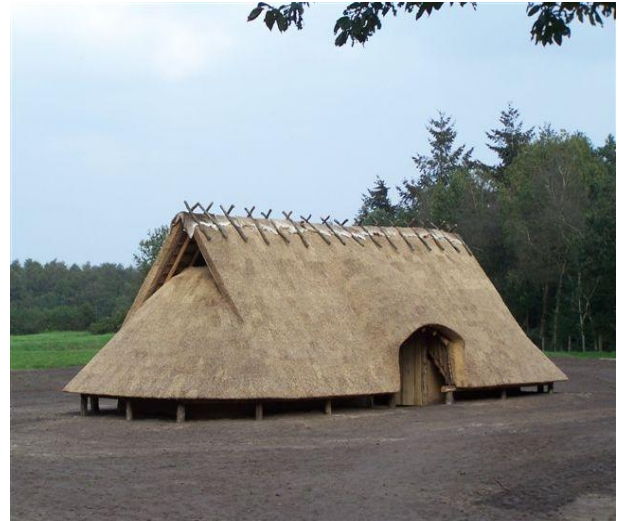
Voorbeeld van een boerderij in de IJzertijd bij het Wekeromse Zand.

gebruikt. Bij de aanleg van de akkers werd de bovenlaag met stenen en stobben verwijderd. Deze werden aan de zijkanten van de percelen opgeworpen. Zo ontstonden er wallekes. De percelen zijn min of meer vierkanten van 30 tot 40 m. Zo'n complex wordt een Celtic Field of raatakkers genoemd. Dit laatste