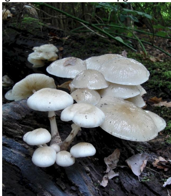
Porseleinzwam op dood hout.

Tegenwoordig is een bos meer dan een groot aantal bomen per hectare. Het is een leefgemeenschap voor plant en dier. Verder heeft bos een recreatieve, productieve en/of beschermende functie en het bezit natuur- en cultuurwaarden. Bij het gebied bij de Galgenberg wordt een natuurlijke bosontwikkeling op gang gebracht. Het is de bedoeling dat hier een natuurbos van het type wintereik, beuk met eik, berk en in geringe mate grove den ontstaat. Belangrijk in zo'n bos is of de bomen in- of uitheems zijn. Het is namelijk van belang voor het behoud van de soort met zijn erfelijke eigenschappen. De belangrijke bomen als beuk, eik en de pionierssoort berk zijn in principe inheems. Of de hier voorkomende beuken en eiken alle inheems zijn, is mij niet bekend. De grove den is van oorsprong inheems, maar de bossen zijn hier vanaf de 2 de helft van de 19 de eeuw aangeplant met buitenlands materiaal (zaad). Het is niet te verwachten dat er een inheemse grove den grond die niet worden opgeruimd.