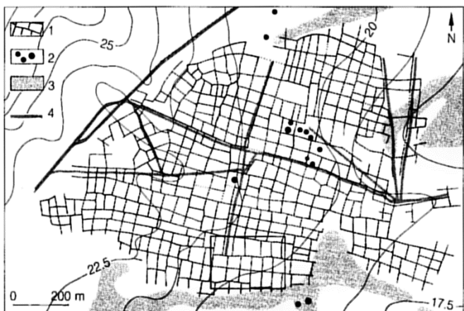
Voorbeeld Celtic Field in Vaassen.

In het landbouwgebied rechts en het bosgebied links ligt een Celtic Field. In de IJzertijd werd een nieuw landbouwsysteem met omwalde akkertjes ingevoerd. Hierbij werd de grond volgens een vast patroon