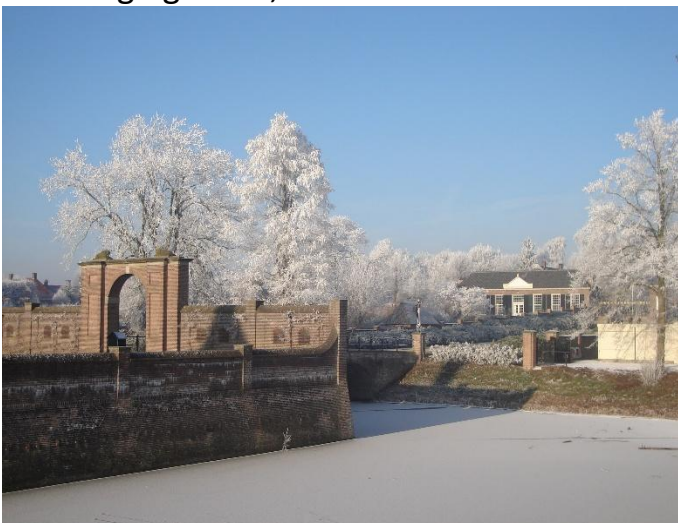
Bij dit pad LA.

lager in het rivierengebied. Richting kasteel ziet u links het gebouwencomplex met stallen en het koetshuis. Aan de grachtzijde van de stallen is een houten, unieke duiventil bevestigd. De duiven werden gehouden voor de duivenmest die in de tabaksteelt werd gebruikt. Tevens werden van duiven lekkere pasteitjes en andere gerechten gemaakt. Zeer fraai zijn verder de monumentale poort en de door grachten omgeven vestingmuren van verdedigingswerk, Het Bastion.