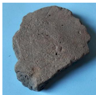
Scherf van de Neder Eng in Amerongen 150-50 v. Chr. Coördinaat: 159.480 en 446.240.