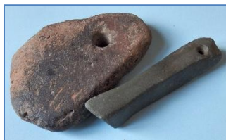
Vishangers, v.l.n.r. aardewerk(evt. Romeinse tijd) en steen.

Gekocht bij de kringloopwinkel, maar vindplaats is niet bekend.