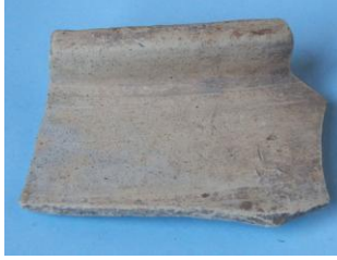
Randscherf uit Wijk bij Duurstede, Romeins?. Coördinaat: 151.600 en 443.880.