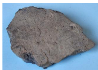
Scherf van de Neder Eng in Amerongen 150-50 v. Chr. Coördinaat: 159.480 en 446.240.