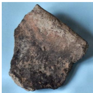
Randscherf uit Wijk bij Duurstede(evt. Romeins). Coördinaat: 151.600 en 443.880.

Gekocht bij de kringloopwinkel, maar vindplaats is niet bekend.