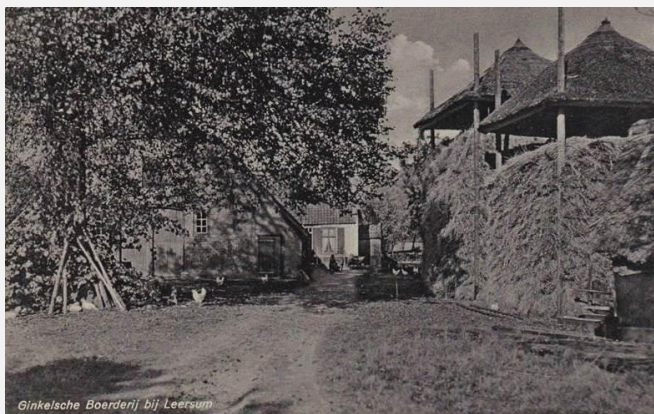
Afbeelding 1. Boerderij Ginkel. Fotokaart H. van Brenk(* op kaart).

Rechtspraken werden daarom niet meer uitgevoerd door particulieren zoals kasteelheren en hun drost, maar door benoemde rechters.