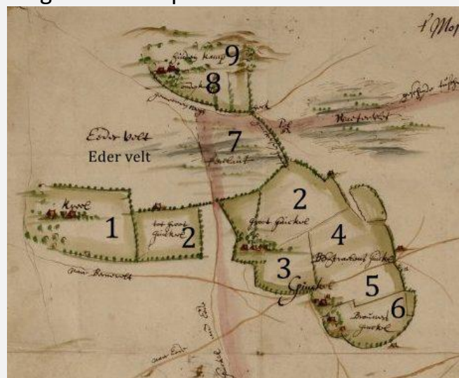
Kaart 3. Detailkaart van kaart uit 1635 met 8 kampnamen en een ander gebied(7). Internet.

het oosten van het land worden dit eenmansesjes genoemd. Deze kampen treft men ook aan langs de Dwarsweg bij Overberg en in Darthuizen. Een boerderij heet Groot Ginkel en dat betekent vanzelfsprekend dat dit een groot bedrijf is. Dat is ook te zien op de kaart, want daar treft men een tweede kamp van Groot Ginkel aan. De akkers werden door een wildwal omgeven om vraatschade te voorkomen. Bovendien leverde dit brand- en geriefhout op.