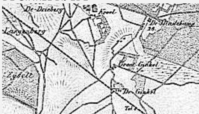
Kaart 2. Detailkaart met kaart van De Ginkel in 1867. Internet.

De Ginkel, Ginckel is een groot heidegebied met een nederzetting met bouwlanden en omgeven door bossen. Dit heidegebied ligt ten oosten van Ede met aan de zuidkant van de N224 de Ginkelse heide en aan de noordkant de Edese heide. Aan de N224 (de voormalige Hessenweg Arnhem-Amersfoort, de lange rechte streep) treft men ook het restaurant Juffrouw Tok aan en dit staat aan de zuidzijde van de nederzetting De Ginkel. De oude bouwlanden liggen ten noorden, ten noordwesten hiervan. De oude bouwlanden zijn hier geen enges, maar kampen. Dat betekent dat het bouwland door één boer werd bewerkt. In