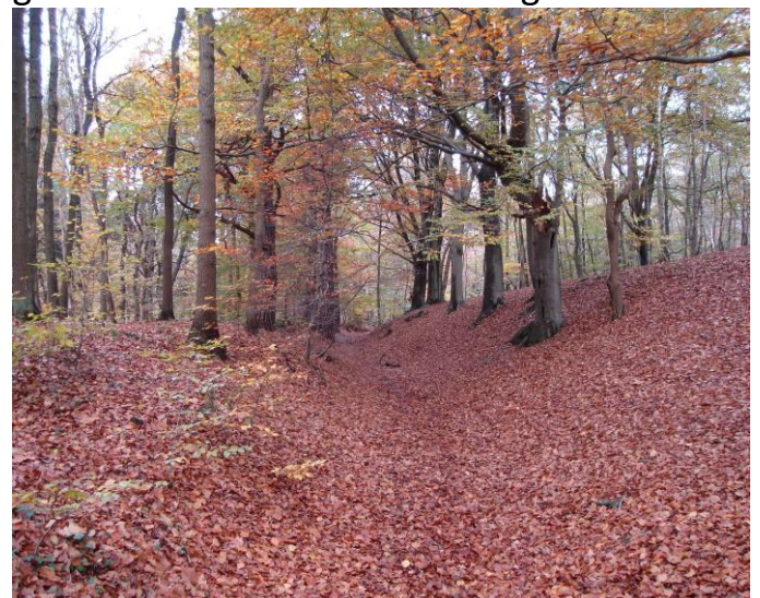
Holleweg De Dooije Weg

Vanaf de prehistorie zijn deze dalen als pad gebruikt. Daardoor werd de vegetatie