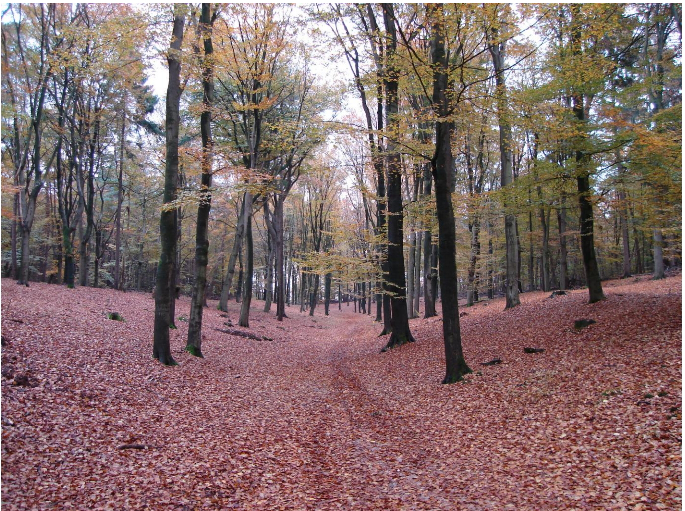
Droog dal bij voormalig Berghuis, nu Mas Montagne.

Artikel in: Dorp&Natuur , nr.59 voorjaar 2013. Tijdschrift van Vereniging Dorp en Natuur Amerongen-Leersum.