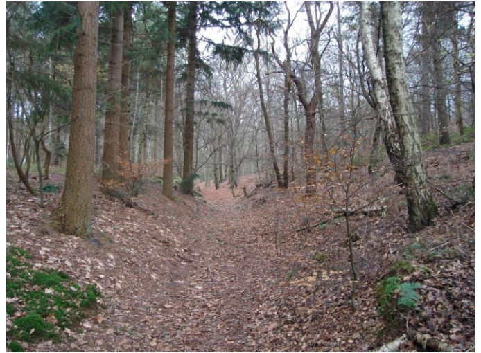
Droog dal en lager gelegen holleweg.

Op de hellingen van de stuwwal zijn ook holle wegen gevormd. Dat betreft bijvoorbeeld De Dooije Weg (1832). Over deze weg werden o.a. overleden mensen uit Overberg naar Amerongen vervoerd. Daarbij werd de vegetatie vernield, de grond los gereden of gelopen en bij iedere regenbui spoelde er grond naar beneden. Deze weg is eeuwenlang gebruikt en zo mm. na mm. ingeslepen en op deze wijze ontstond er een holle weg, een cultuurhistorisch belangrijk element. De ligging van deze weg is (afgerond) U-vormig.