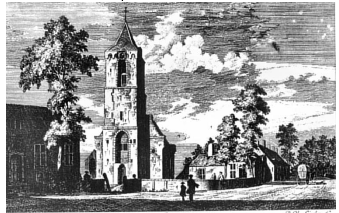
t Dorp Leersum by Utrecht 1755 .

Het heeft een smaller koor en een bakstenen schip. Onder: kerk in 1755.