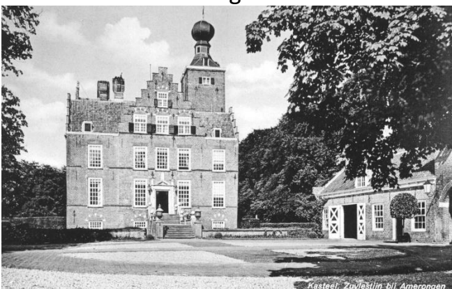
Kasteel Zuylestein voor 1945.

Rechts ziet u het nieuwe Huys Zuylestein. Dit laatste werd in 1982 gebouwd. De bouwstijl is afgeleid van het oude kasteel. De toegang wordt door een fraai smeedijzeren hek gevormd. De ridderhofstad kent zijn oorsprong in de 14 de eeuw. Het bestond toen uit een enkele woontoren, een donjon en deze werd in 17 de eeuw uitgebreid. Van de