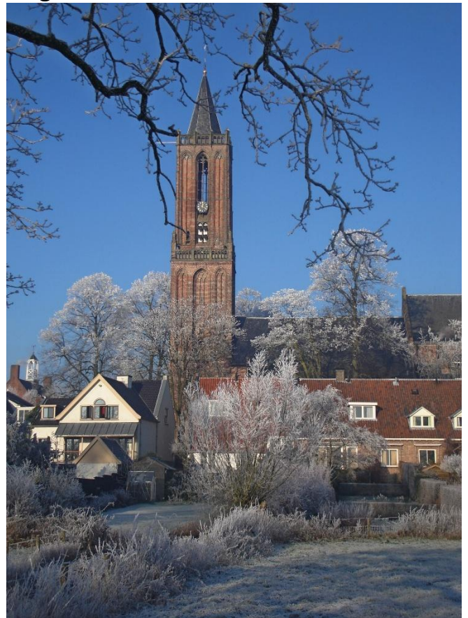
Aankomst en start route voor de Andrieskerk.

9 Deze Veenseweg door het bos tot de N225 volgen en daar RA, vervolgens 1 ste weg LA en iets LA en daarna RA en bij 1 ste weg LA naar de kerk.