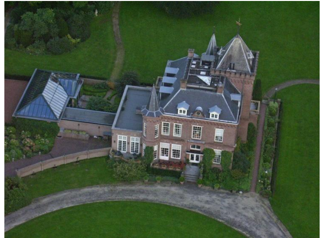
Luchtfoto kasteel Prattenburg.

In het begin van de Veenseweg is vanaf de Groene Entree de Groene Wandelroute te lopen. Het hoogteverschil tijdens deze route is ca. 100m. De looptijd voor deze 6,8km lange route is 1,5-2 uur.