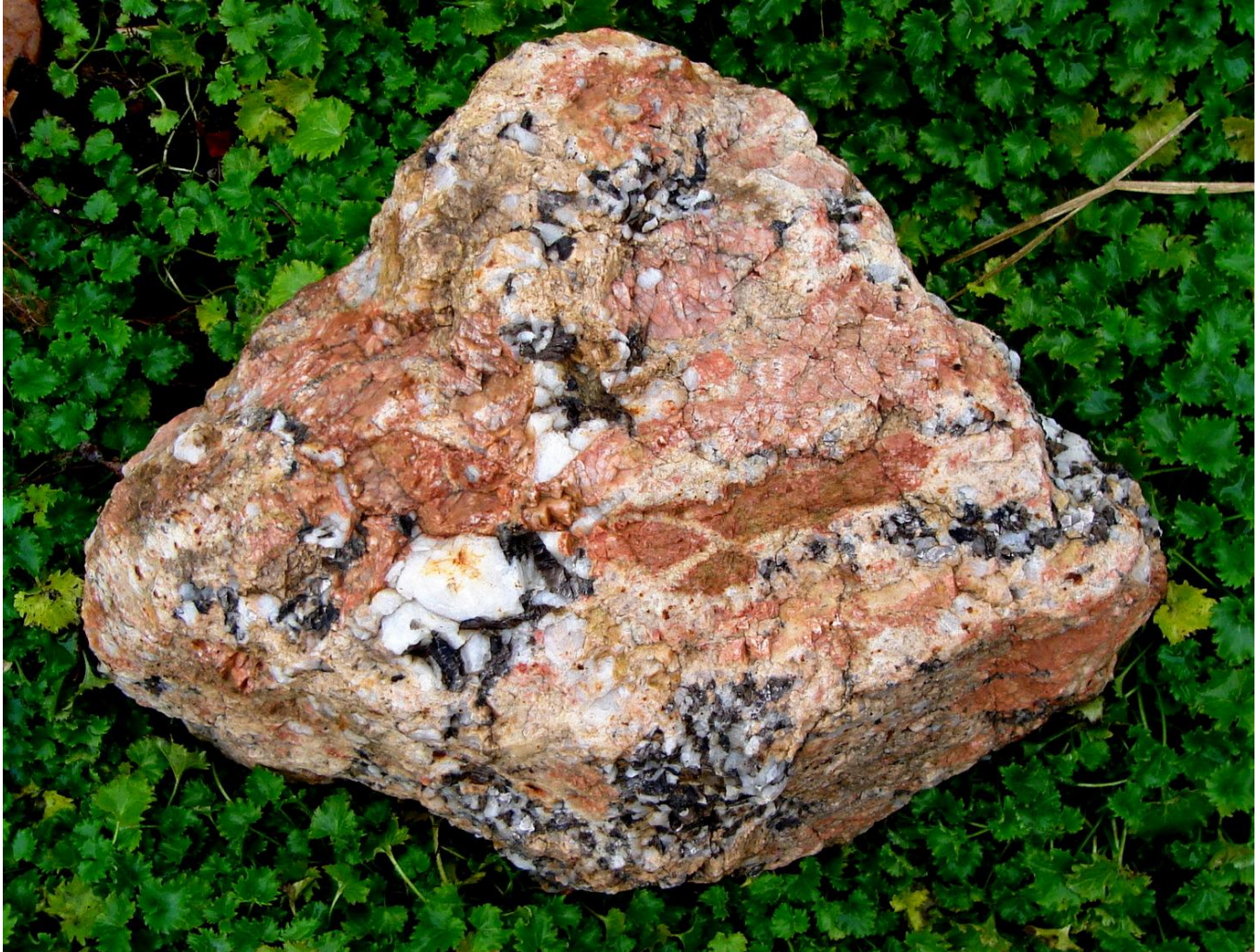
Extra grote foto.

Dit artikel verscheen in Dorp&Natuur, nummer 84 – najaar 2025. Tijdschrift van de Vereniging voor Dorp en Natuur Amerongen-Leersum.